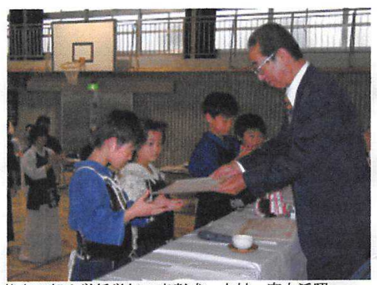
基本の部小学低学年の表彰式。水村一家大活躍

自転車は奥の自転車置き場へ。危ないのできちんと奥の駐輪場にとめましょう。学校からも注意を受けました。