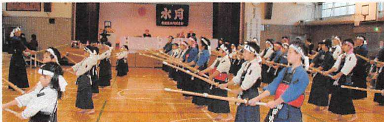
村岡先生のお写真と奥様が見守るなか、みんな元気に試合をしました