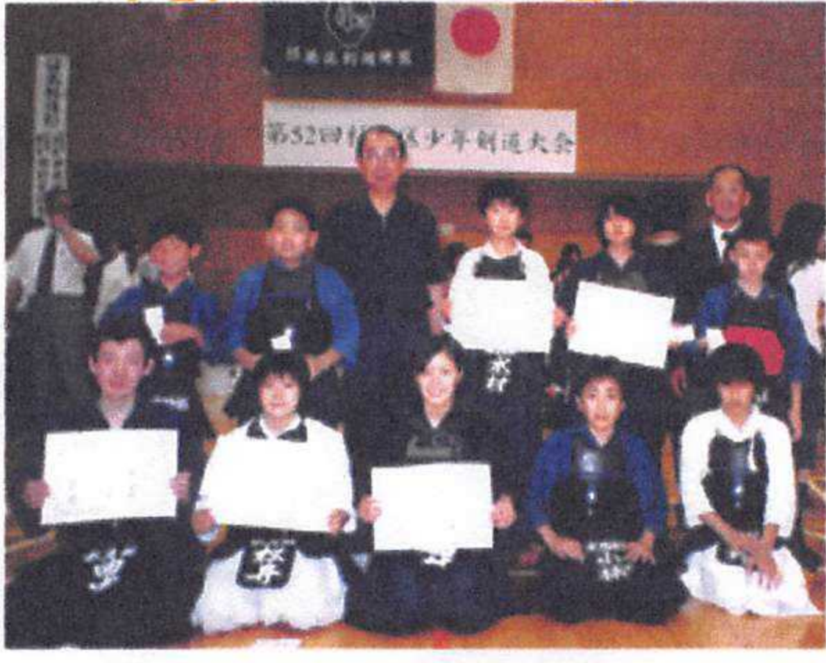
団体戦のうれしい賞状と共に