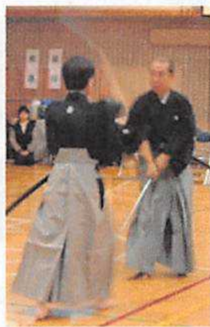
村岡先生の形を再現