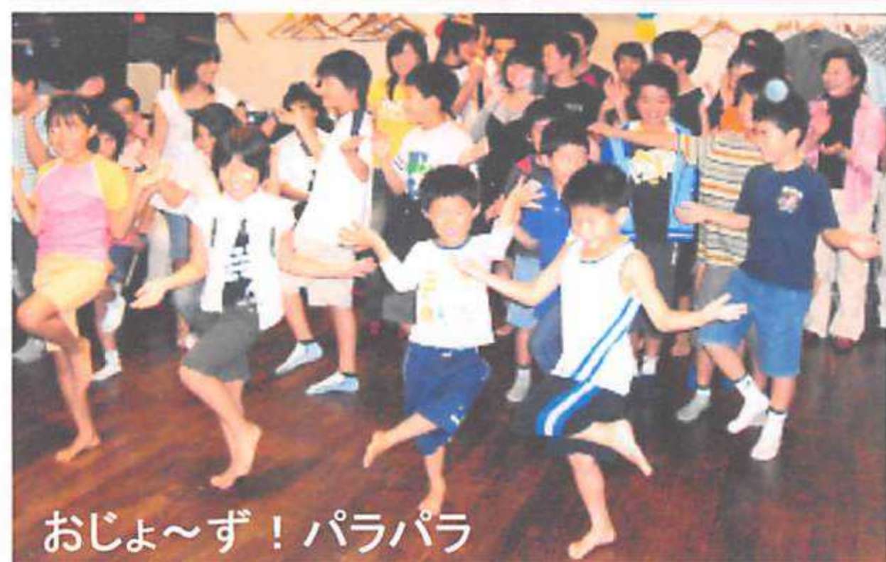
おじよ〜ず！パラパラ