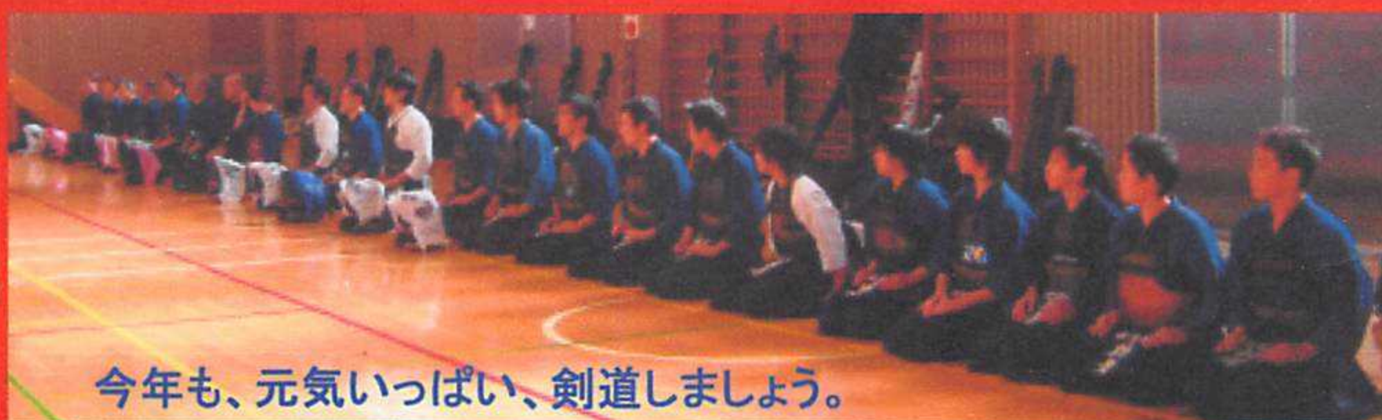
今年も、元気いっぱい、剣道しましょう。