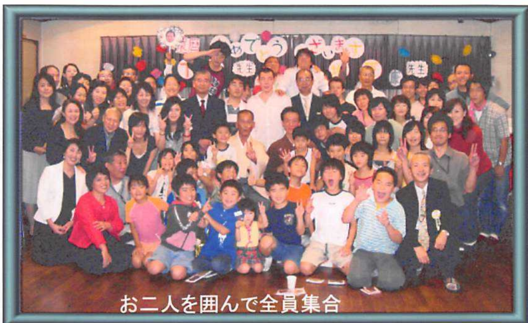
お二人を囲んで全員集合