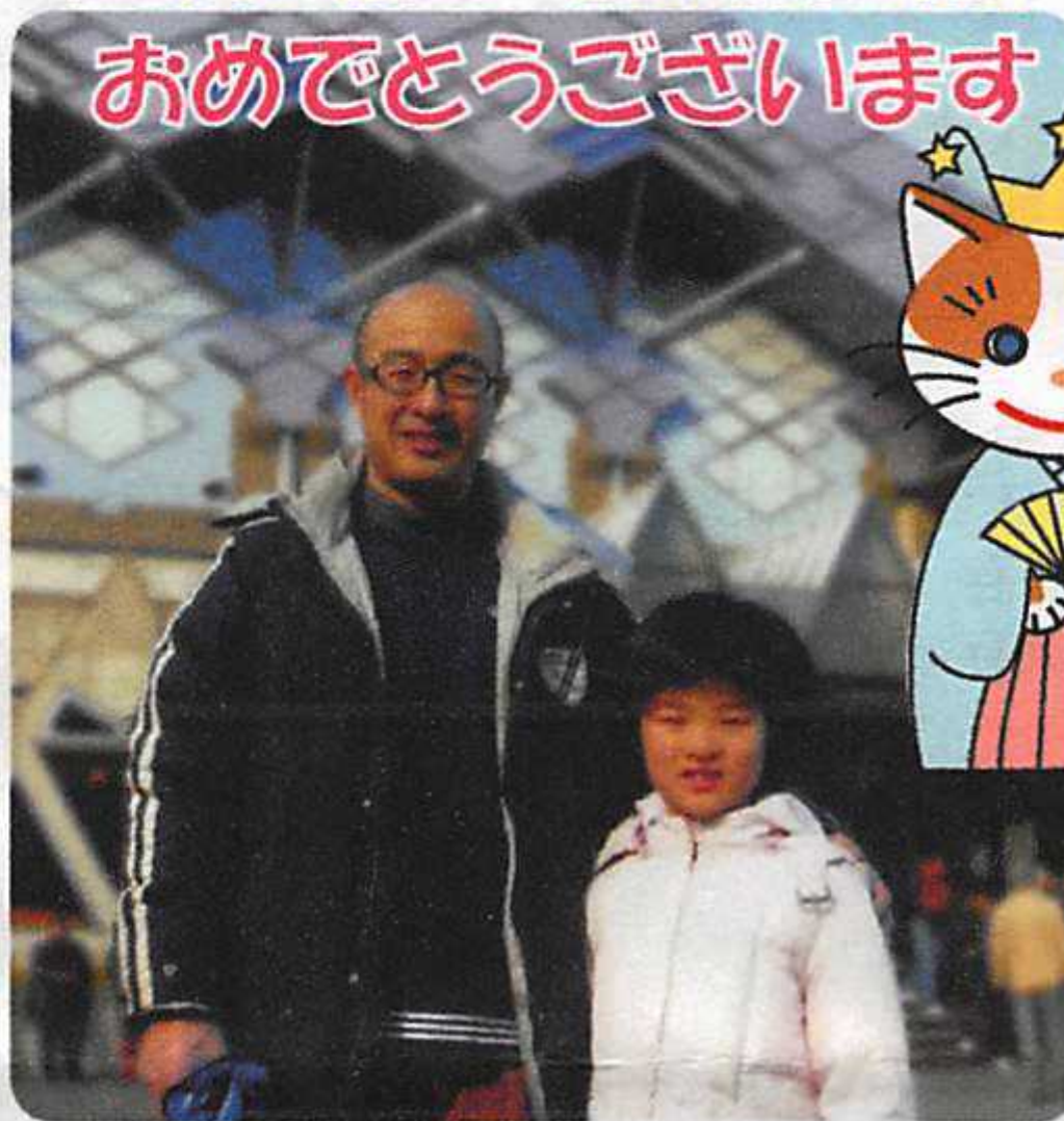
千恵ちゃんの応援で、父はがんばりました