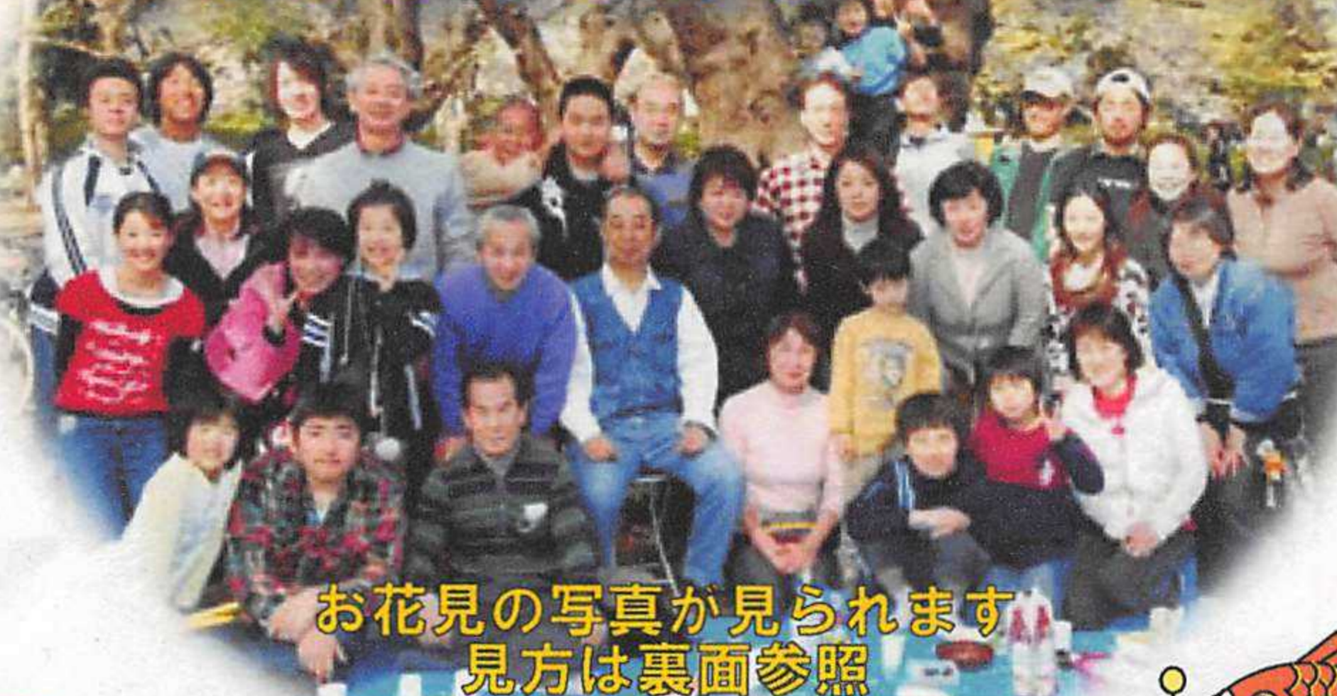
お花見の写真が見られます 見方は裏面参照