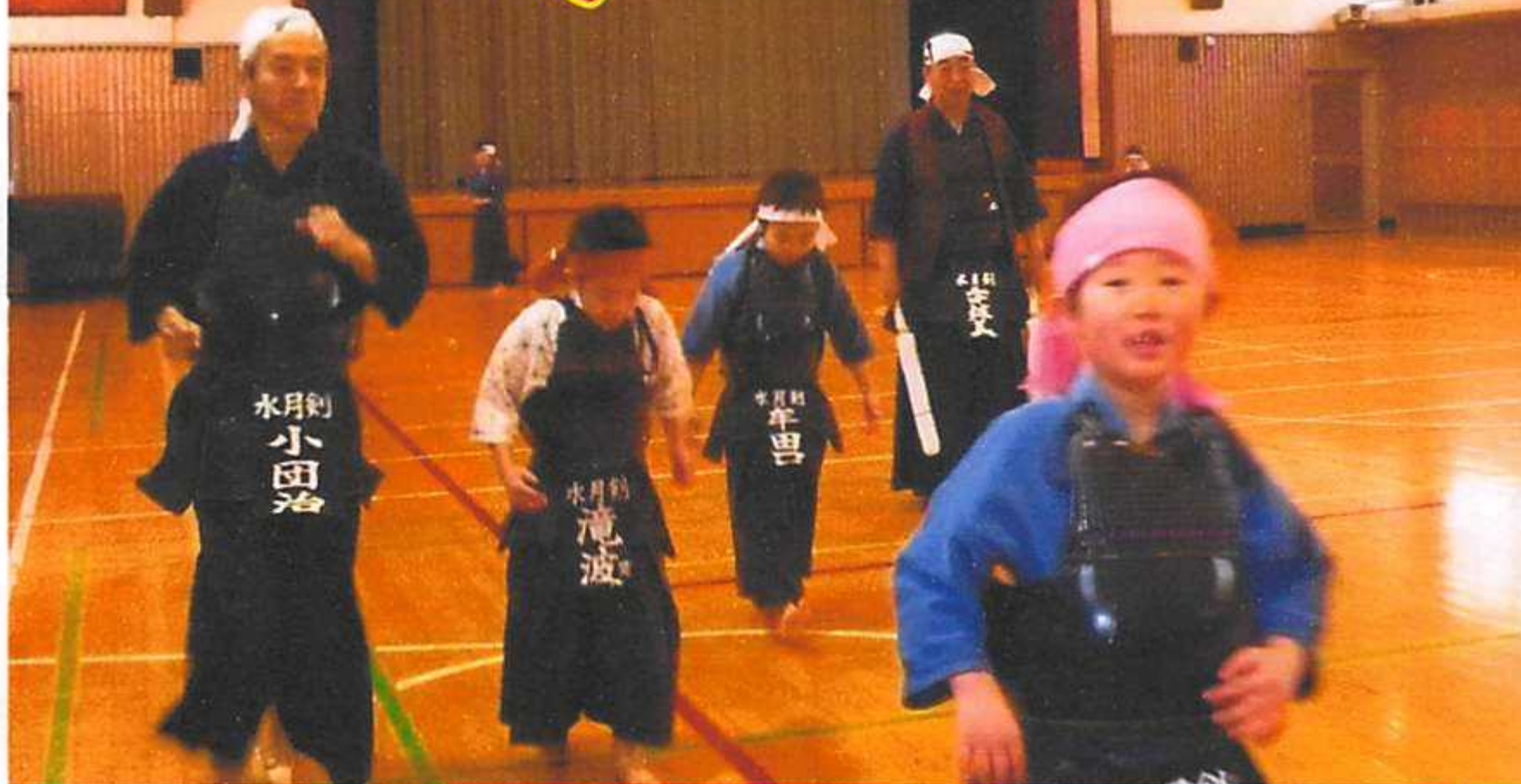
1月20日 稽古風景・寒い朝、走れば走るほど足がつめた〜い。