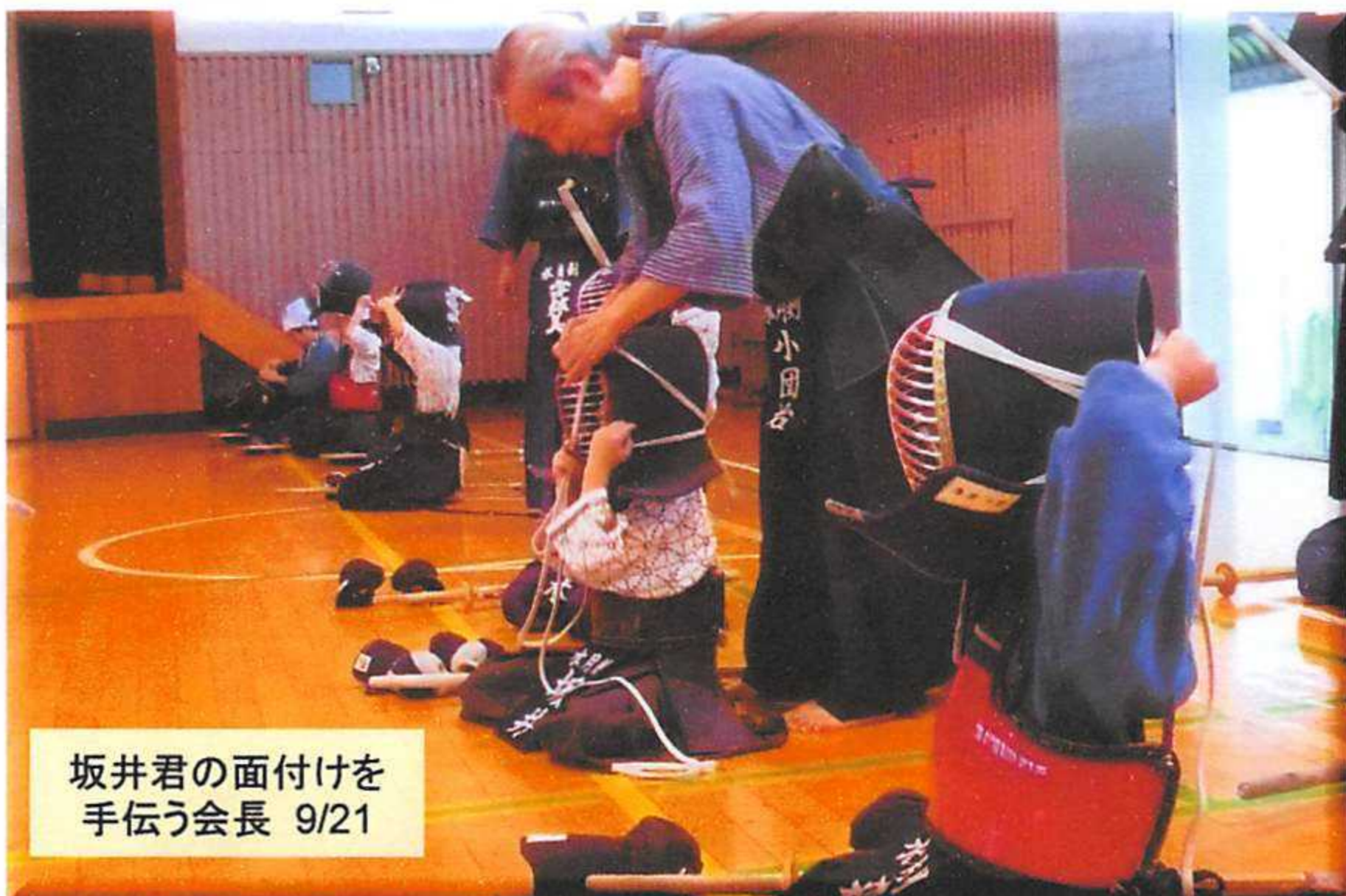
坂井君の面付けを手伝う会長 9/21