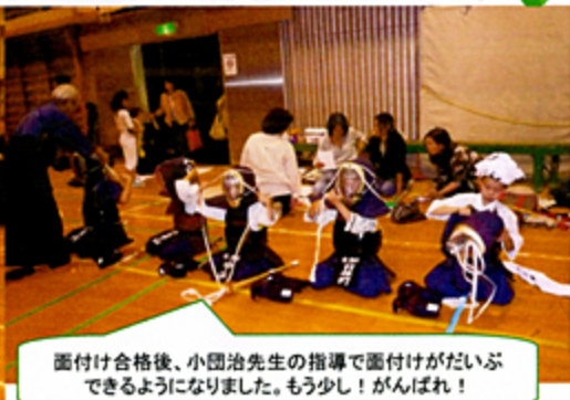
面付け合格後、小園治先生の指導で面付けがだいぶできるようになりました。もう少し！がんばれ！