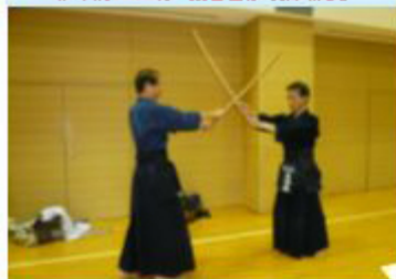
9/26(土)に剣道で指導者を対象とした「木刀による剣道基本技術古法」の講習会が開催されました。