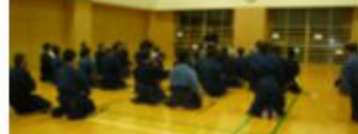
ロッカーを直し上げます (役員より)

杉七小で使用していた水月の荷物を入れたロッカーが、書え付けの欄に収納できたのでロッカーが不要になりました。どなたかもってきてください。