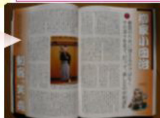
(合宿作文集10月中、お手元にお寄せます)