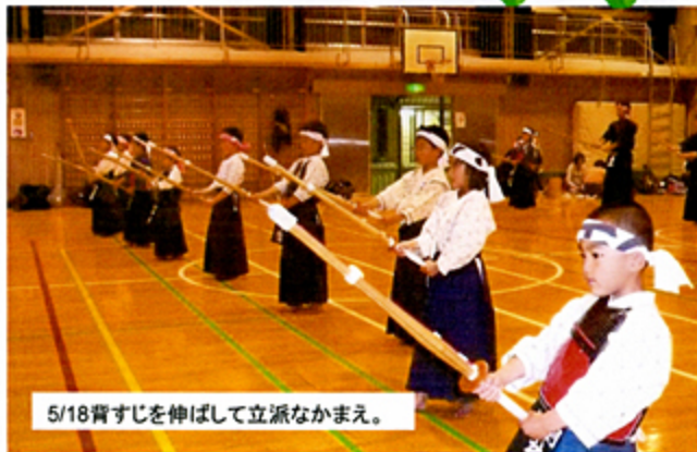
5/18背すじを伸ばして立派なかまえ。