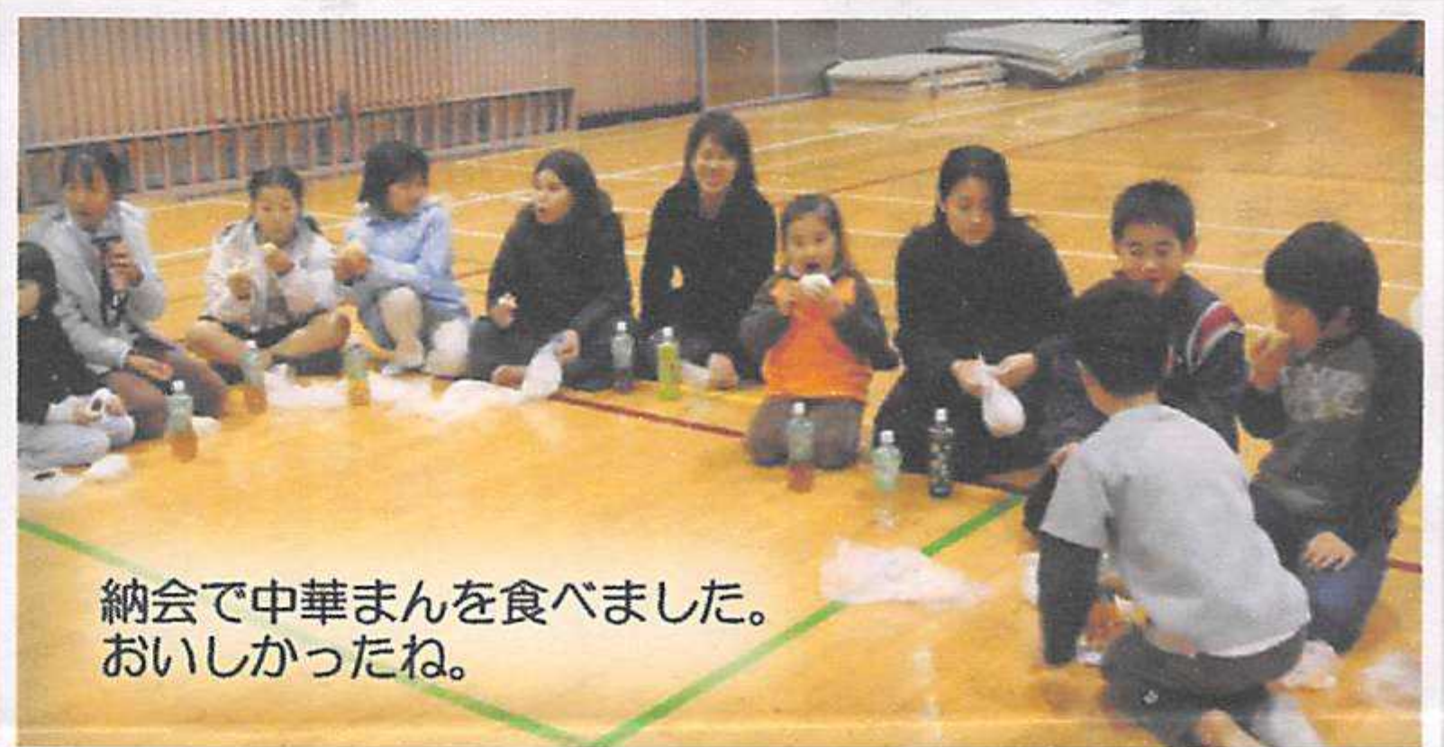
納会で中華まんを食べました。 おいしかったね。