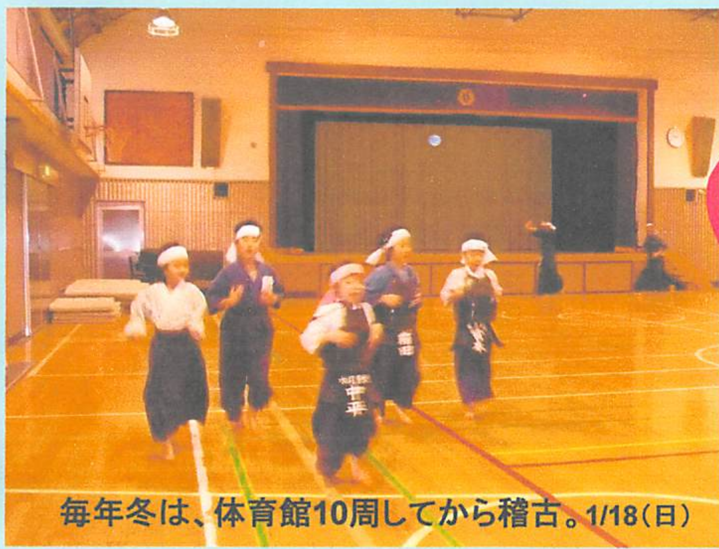
毎年冬は、体育館10周してから稽古。1/18(日)

近年思うこと。子供たちと一緒に体育館を走っていてふと気付いたのです。体育館の床が四・五年前からそんなに冷たくなくなりました。十年前の床は氷のようで、朝稽古は動けば動くほど足裏が冷たくなり二時間ほどしてやっと体が温かくなり、足の冷たさを感じなくなりました。近年は氷のような冷たさがありません。地球は確実に温暖化しています。剣道を長年やってきて自分の足裏から地球が少しずつ壊れ始めているのを感じます。